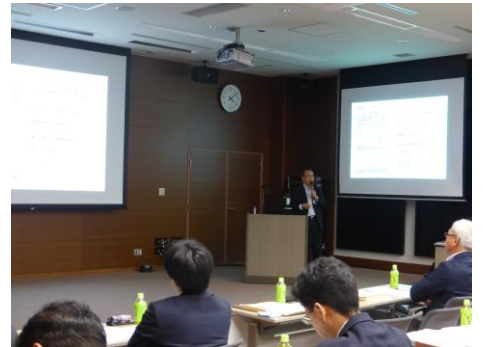
国土交通省 東北地方整備局