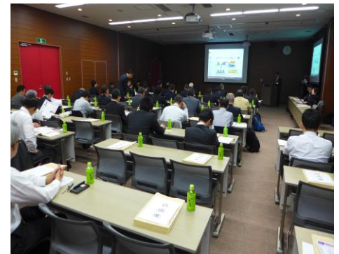
山形県県土整備部道路保全課